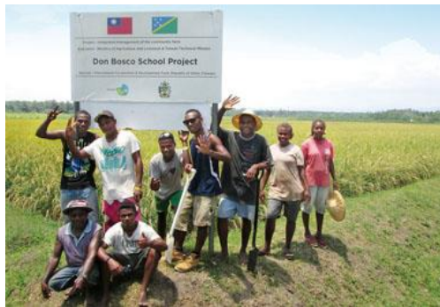
(20 世紀的台灣農耕隊)