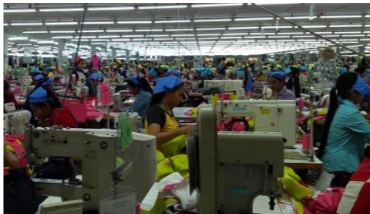
(建教合作 ~ 磅通省 HSB 中學)